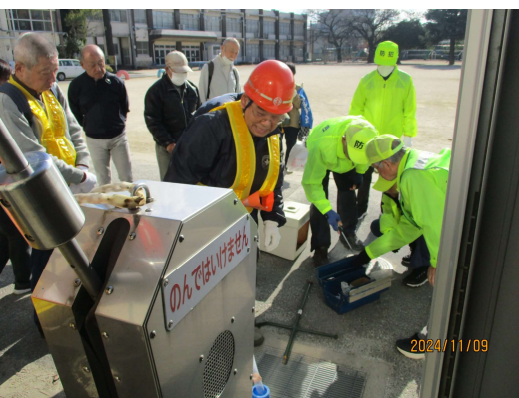
防災用井戸ポンプの設営