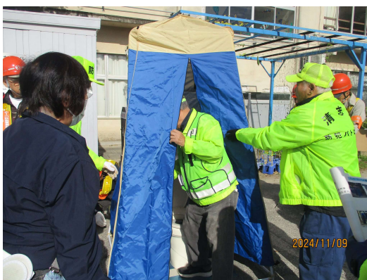
マンホールトイレの設営