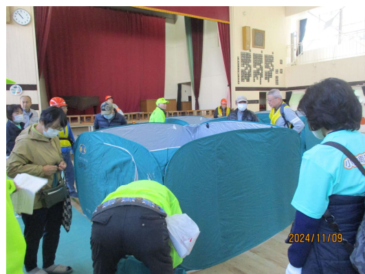
避難所テントの設営