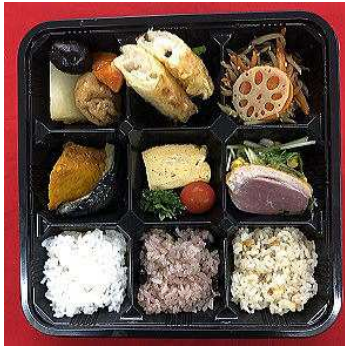
彩り弁当（海老湯葉まき） 税込800円

会場設営/11：00～ ランチミーティング/11：30～13：30 会場撤収/13：30～